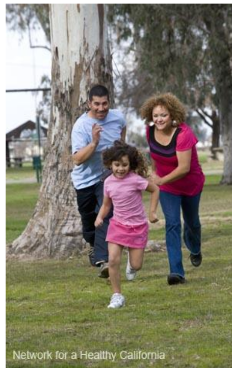
Network for a Healthy California